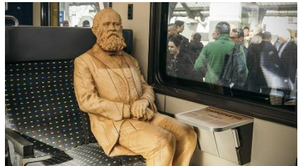
Abbildung 1, Alfred Escher aus Schweizer Holz (werbewoche.ch, 2017)

Am 15. bis 17. September kommt die Aktion Woodvetia nun zu Ihnen. Die Forstbetriebe der Gemeinden Kleinandelfingen und Andelfingen sowie der Staatsforstbetrieb Rheinau zeigen Ihnen zusammen mit der Robert Schaub AG die gesamte Holz-kette. Sozusagen vom Wald in Ihr Haus, in Ihre Stube oder in Ihre Heizung.