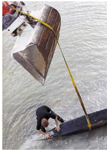
Rettungsgrabung für Brückenpfahl im Rahmen der Thursanierung bei Andelfingen

einem Gesamtgewicht von gegen zwei Tonnen. Was aber hat die Andelfinger Brücke mit unserer Gemeinde zu tun?